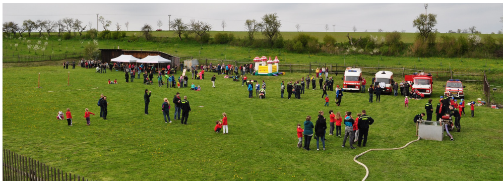
Okresková hasičská soutěž