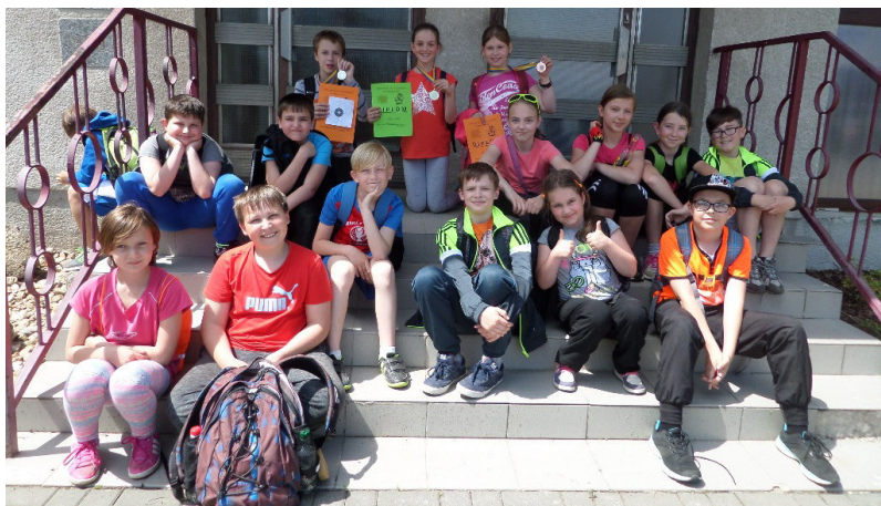
Sportovní soutěž žáků ZŠ ve Studenci

výstavu týkající se železniční dopravy. Jako dárek pro ně byl nejen vstup zdarma, ale všichni dostali na památku i časopis a lego figurku.