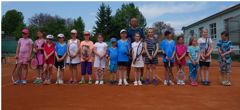
Tenisový miniturnaj dětí 28. 5. 2016