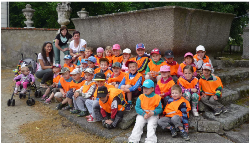
Výlet MŠ do Budišova

Opět jsme toho spoustu zažili a jsme plni nových zážitků. V měsíci březnu navštívili předškoláci Alternátor – ekotechnické centrum v Třebíči, kde se seznámili s programem, „Co všechno umí sluníčko“ - seznámení s vlivem Slunce na život na Zemi. V měsíci dubnu jsme se ve školce sešli poněkud netradičně, přivítali jsme se v čarodějnických kostýmech čarodějů, čarodějnic, kouzelníků a ježibab. Bylo to opravdu kouzelné dopoledne. V květnu jsme ukázali našim maminkám a příbuzným, jaké jsme šikulky. Předvedli jsme několik tanečků, zazpívali spoustu krásných písniček, zarecitovali básničky a zahráli divadélko O Šípkové Růžence. Nakonec jsme maminkám předali vlastnoručně vyrobené dárečky. V červnu jsme se vydali vlakem na zámek Budišov, kde jsme viděli krásná zvířátka, něco jsme se o nich dozvěděli. Jako menší rozloučení se školkou přespali předškoláci ve školce, kde zažili spousty legrace, soutěží a odnesli si na památku drobné dárečky a trička. Za celý kolektiv MŠ přejeme Všem krásné prázdniny!