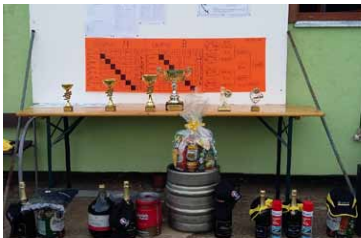
Ceny v turnaji v minikopané 23. 7. 2016