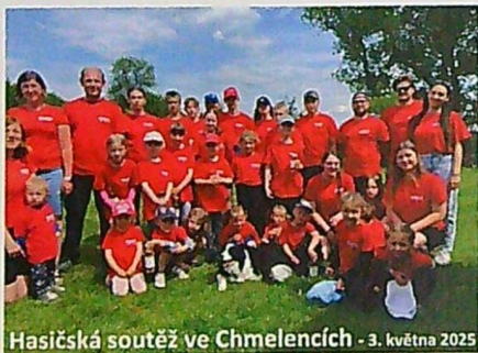
Hasičská soutěž ve Chmelencích - 3. května 2025

V úterý 27. května k nám do hasičky zamířili žáci z kralické ZŠ a ve