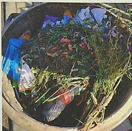
Kytička na uvítanou pro popeláře u domu č.p. X

z poplatku, který „je na hlavu“, na trošku jiný systém, kdy přes peníze, ale v souladu se zákonem donutíme některé naše drahé spoluobčany, aby trochu víc třídili, což je jedna věc a druhá, když už není skutečně dost dobře možné, aby jednotlivci, který donedávna tvrdil, že popelnice vůbec nepotřebuje, měl dnes najednou za 550 Kč sběrné nádoby tři. To stejné bude muset být trochu jinak u kartiček na sběrný dvůr, kde také není možné, aby v rámci jednoho poplatku, tedy 550 Kč se vyvezlo 10 tun stavebního odpadu, který do „komunálu“ vůbec nepatří, bude se muset účtovat a platit stavebníky zvlášť. Časem se nám možná podaří i přesvědčit svozovou firmu, která zatím na to moc neslyší, aby se „vážily“ jednotlivé domácnosti, což by bylo patrně nejspravedlivější a nejlepší, jak vůči obcím, tak jejich občanům. Ono se vlastně váží už v současné době, kdy máme přesný přehled o tom, kolik se kde, čeho