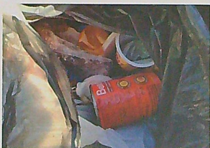
Vzorně vytríděné popelnice u domu č.p. Y