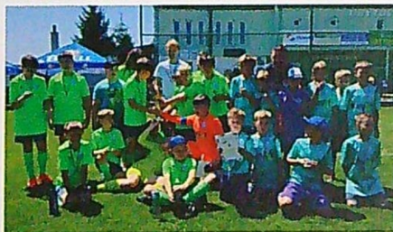
Turnaj Koněšín starší přípravka 2. místo, mladší přípravka 6. místo

Během posledních třech měsíců jste mohli a dále můžete reagovat na výzvu „Nachod' nejvíce kroků“. Jedná se o výzvu k pohybu pro občany – počítáme našlapané kroky a kilometry a snažíme