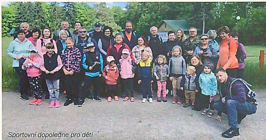
Sportovní dopoledne pro děti

i Kralice nad Oslavou. Na celé Vysočině pořádalo běh jen pět obcí a my byli mezi nimi. Účast sice nebyla velká, ale věříme, že si to velcí i malí běžci užili a že za rok se sejdeme ve větším počtu a už tu budou opravdu „velké“ závody. Moc díky všem účastníkům.