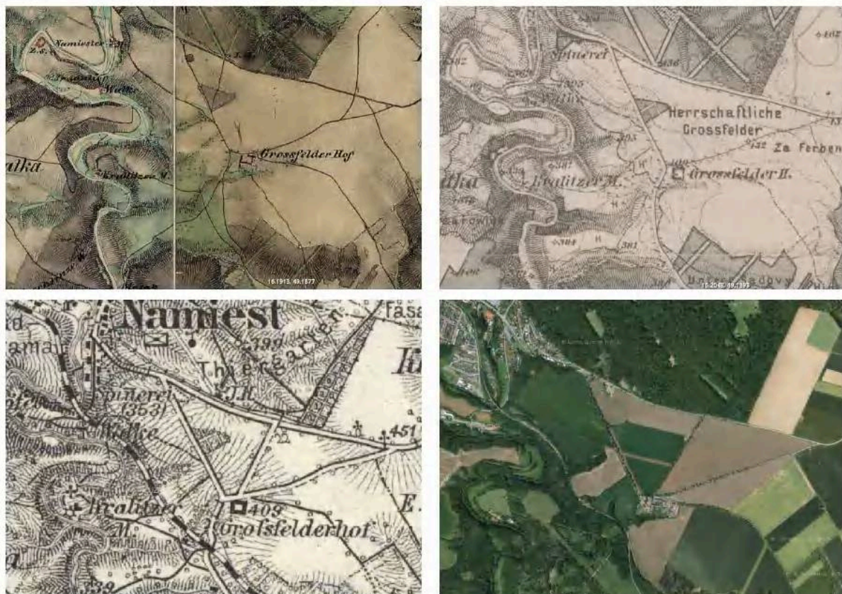
Obr. 3 Velkopolský důr bez vyznačených alejí na mapě II. vojenského mapování (1839-1842), s vyznačenými alejemi na mapě III. vojenského mapování (1869-1876) ( https://maps.arcanum.com/ ) a s pěti alejemi (na Náměť, k oboře, ke Kralicím, k Březníku a k Velkopolskému mlýnu – zákres z roku 1909 ve Speciální mapě III. vojenského mapování ( https://ags.cuzk.cz/archiv/ ))

Krajinářsky velmi atraktivní partií je soustava alejí kolem Velkopolského dvora – napojení Velkopolského dvora alejemi na Náměštskou (Kralickou) oboru a na Kralice. Zatímco v první polovině 19. stol. nejsou v mapě II. voj. mapování aleje značeny, na mapě II. vojenského mapování z druhé poloviny 19. stol. je již vyznačena alej podél cesty na Náměšť, na Kralice a na Březník. Teprve ve stavu, mapovaném k roku 1909 se objevuje i nová cesta s alejí, směřující k oboře a krátká alej při cestě směřující k Velkopolskému mlýnu. Aleje jsou v současné době tvořeny různými okrasnými dřevinami, přičemž tzv., Severní alej (směřující k oboře) je tvořena duby a jírovci a Severovýchodní (směřující na Kralice) jírovcem. V ostatních alejích se nacházejí javory, jilmy, lípy a jírovce, v malé míře trnovníky a jeřáby 6 . Partie krajiny kolem Velkopolského dvora s kontrastem otevřených ploch polí, alejí okrasných dřevin a okraje mohutných porostů obory ohraničené kamennou ohradní zdí představuje cenné scénérie novodobých krajinářských úprav, dotvářejících starší krajinářskou kompozici.