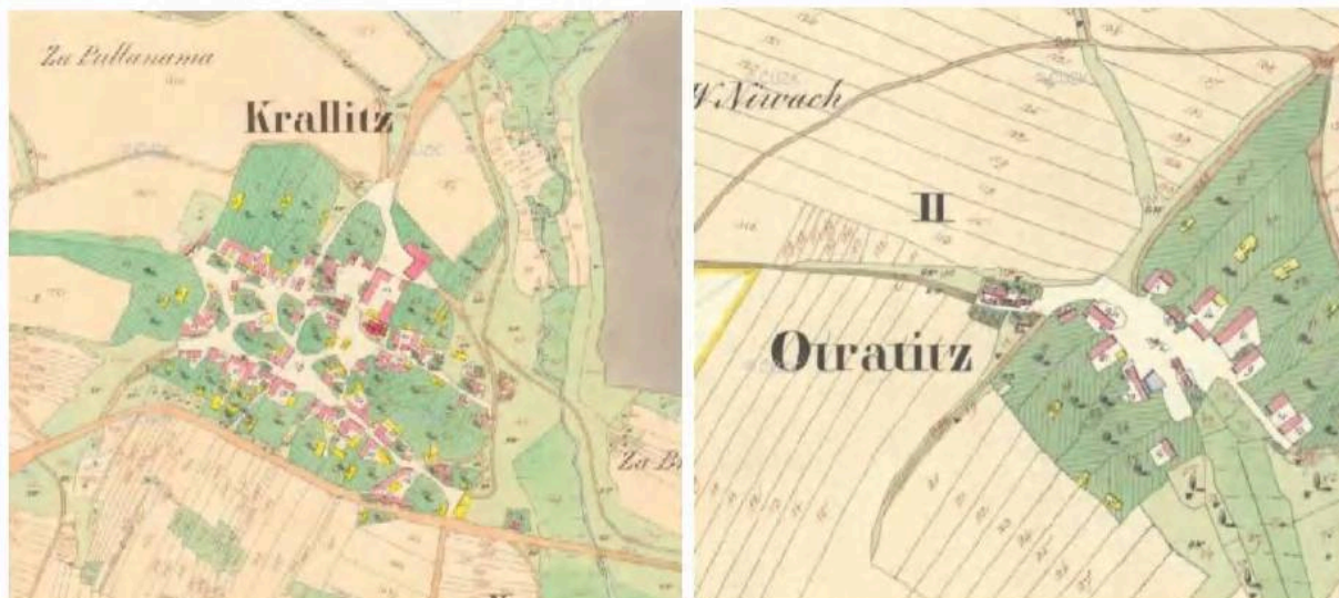
Obr. 8 Sídla Kralice nad Oslavou (vlevo) a Otradice (vpravo) na Císařských povinných otiscích stabilního katastru (1825) (archivnimapy.cuzk.cz)