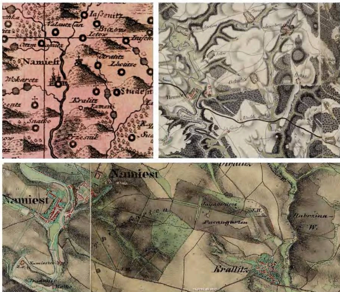
Obr. 1 Müllerova mapa – Morava (1720), mapový list 10 ( http://oldmaps.geolab.cz/ ), I. Vojenské mapování – Markrabství Moravské, 1764-1768, II. vojenské mapování Moravia (1836–1842) ( https://maps.arcanum.com/ )

Na Müllerově mapě – Morava z roku 1720 jsou vyznačeny hlavní body krajiny – zámek v Náměšti v dominantní poloze, sídla Kralice a Otradice a Velkopolský dvůr. Obora vyznačena na této mapě není. Objevuje se až na mapě 1. vojenského mapování z let 1764-1768. U Jinošova je na mapě 1. vojenského mapování značena bažantnice v místě pozdějšího parku. Renesanční vrstva vývoje krajiny v KPZ spočívá v přestavbě zámku za Jana staršího ze Žerotína v roce 1578 a v přetváření lesního porostu do podoby obory. O tom svědčí nejenom zmínka o oboře z roku 1628, ale též její členění průsekem, navazujícím na nárožní arkýř vzniklý při přestavbě zámku a na skutečnost, že tato osa končí na hranici obory a nemá vzdálenější vizuální cíl v krajině. Dalším počinem je renesanční přestavba tvrze v Jinošově v 16. stol. a renesanční přestavba tvrze v Kralicích v roce 1542. Z roku 1572 pochází první pís. zmínka o Kralickém (Velkopolském) mlýnu, který byl však vybudován zřejmě již ve 14. stol. pány z Kralic. Do renesančního období spadá i slavná historie panství spojená s činností Jednoty bratské. Jan st. ze Žerotína poskytl bratřím svoji tvrz v Kralicích, aby si tam v roce 1578 přesunuli tiskárnu z Ivančic. Zde vznikly první tisky Bible Kralické (1579–1593, 1596 a 1613).