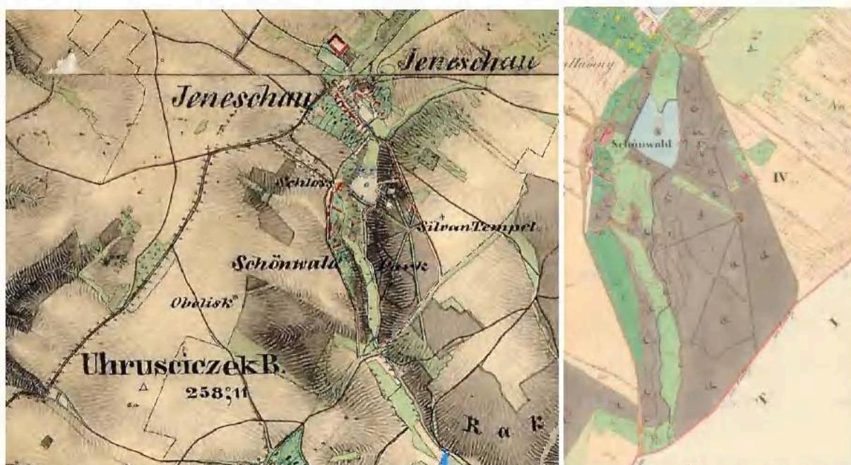
Obr. 2 Il. Vojenské mapování, 1836-1842 ( https://maps.arcanum.com/ ), Císařské povinné otisky stabilního katastru 1:2880 – Morava a Slezsko, 1825 ( https://ags.cuzk.cz/archiv/ )

Těsně před rokem 1823 angažoval Jindřich Vilém Haugwitz slavného vídeňského architekta Josefa Kornhäusela kvůli projektu rodové hrobky v Náměšti, která byla dokončena v roce 1826. Kornhäuselovi byla svěřena i přestavba zámku a parku Schönwald, kde od roku 1825 vyrůstaly nový Dianin chrám (Rast-Pavillon, na východním břehu rybníka), Apollónův chrám (Musictempel, jižně od rybníka) s dominantním motivem lyry s nedalekým vinným sklepem a pravděpodobně i další drobné stavby.