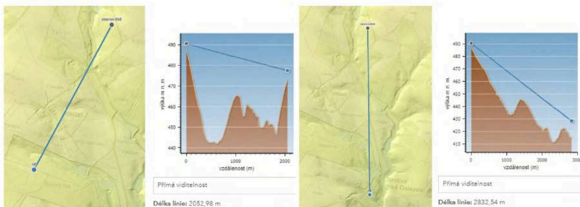
Obr. 4 Vizuální osa Silvanův chrám – Lusthaus, vizuální osa Silvanův chrám – kostel sv. Martina 9

Vizuální spojení Silvanova chrámu v Schönwaldském parku s letohrádkem Lusthaus v Kralické bažantnici je možné za předpokladu obnovení průseku podél cesty v Schönwaldském parku. Vizuální osa využívá vysokých poloh obou objektů – jak v rámci parku, tak i v rámci bažantnice.